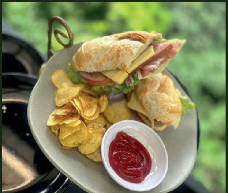
Sándwich de Jamón y Queso