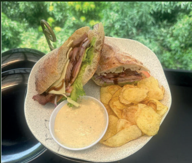
Sándwich de Bondiola