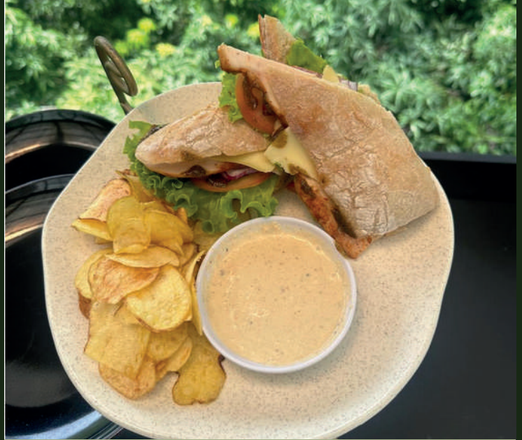
Sándwich de Pollo