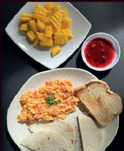
Huevos al Gusto