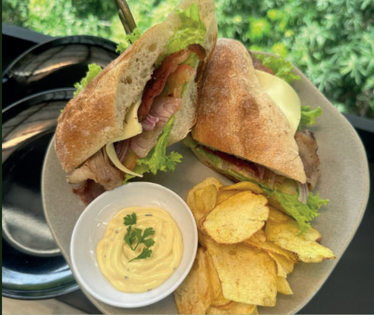
Sándwich de Tocineta